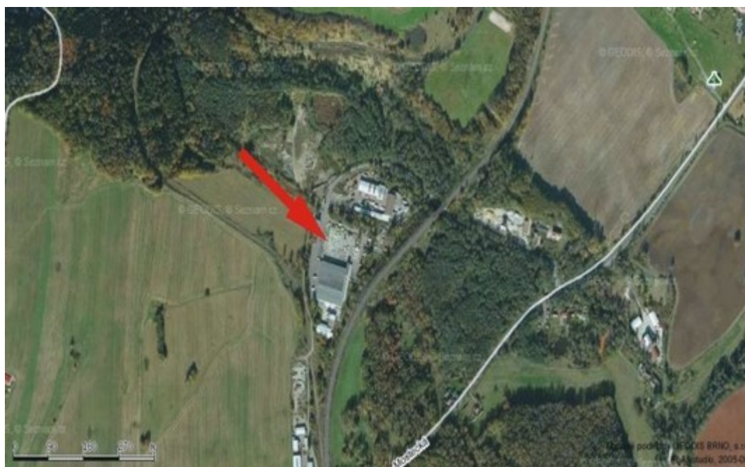
6) SNÍMEK Z KATASTRÁLNÍ MAPY