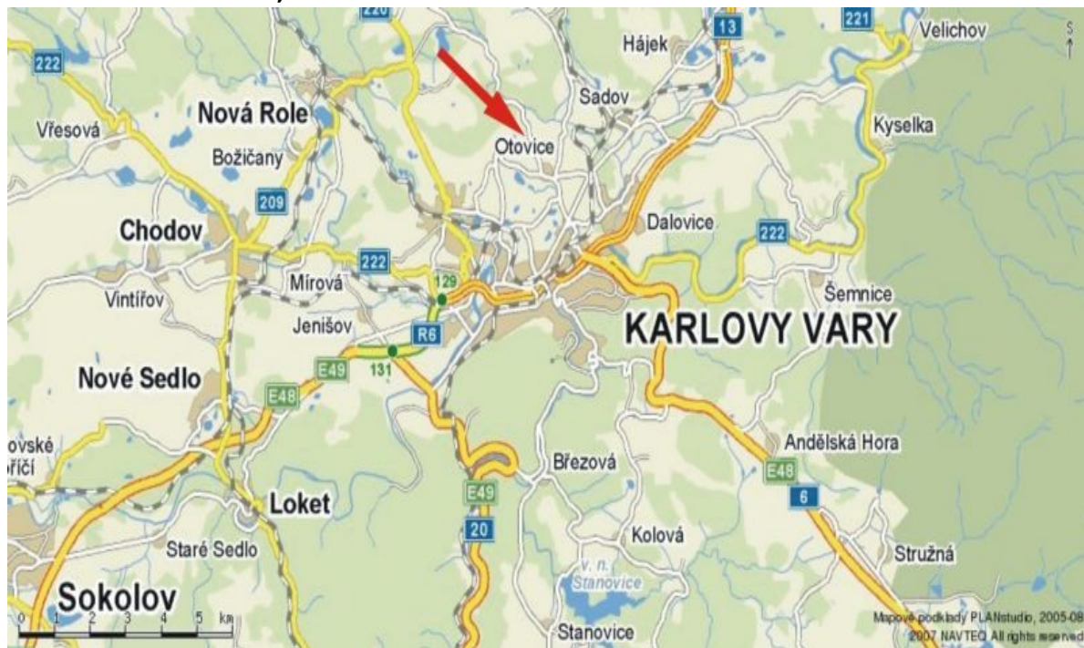
mapa 2: Umístění areálu v obci